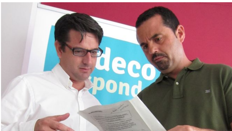
García destaca la "recapitalización humana, social y material" de Sadeco tras las "sombras" del PP CÓRDOBA | EUROPA PRESS